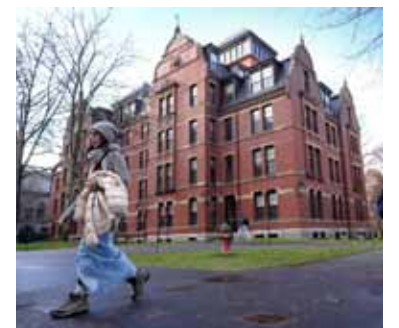
La Universidad de Boston otra vez en la mira.

Anteriormente, Trump intentó prohibir la matriculación de estudiantes extranjeros en este centro educativo, una medida que esta misma jueza federal bloqueó de forma indefinida.