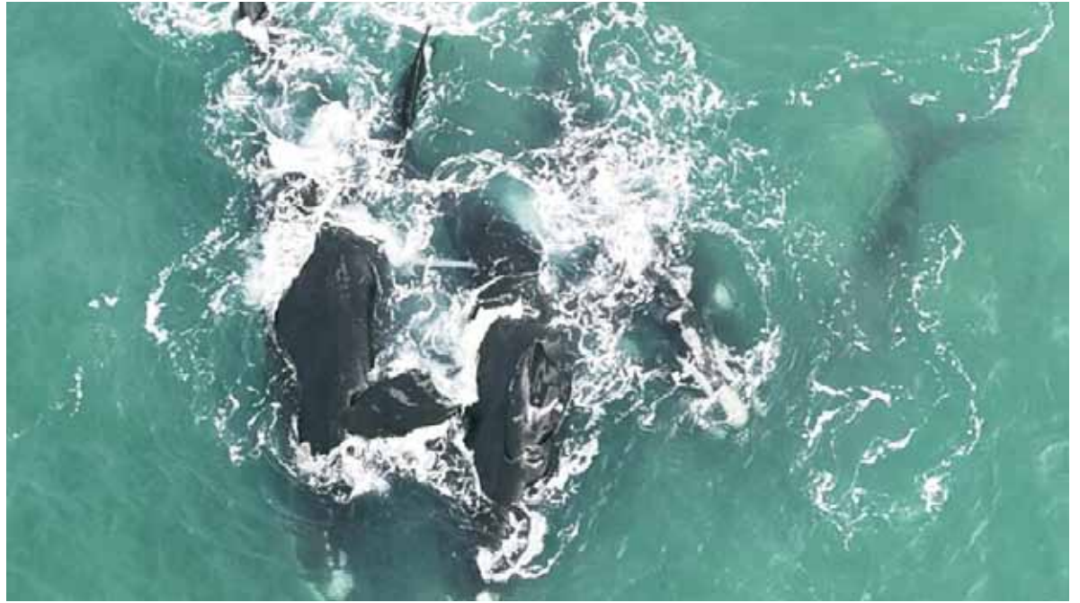
Cópula. Son ejemplares de Ballena Franca Austral registrada en Mar del Plata por el Grupo de Investigación Biología, Ecología y Conservación de Mamíferos Marinos. (FOTO: Fernando Macchi)

Otro de los factores que facilita el estudio de la conducta y los ciclos de estos mamíferos marinos es el avance de la tecnología. “Los últimos dos años, gracias al uso de drones que nos permite acercarnos más, hemos comprobado que se han observado comportamientos de cópula en las costas de Mar del Plata; no obstante, no todos los avistajes son cópulas o parejas madre cría, y no hay registrados nacimientos observables, aunque sí presencia de cachorros, por eso podemos decir que, si bien están apareciendo ejemplares con mayor frecuencia, no significa que