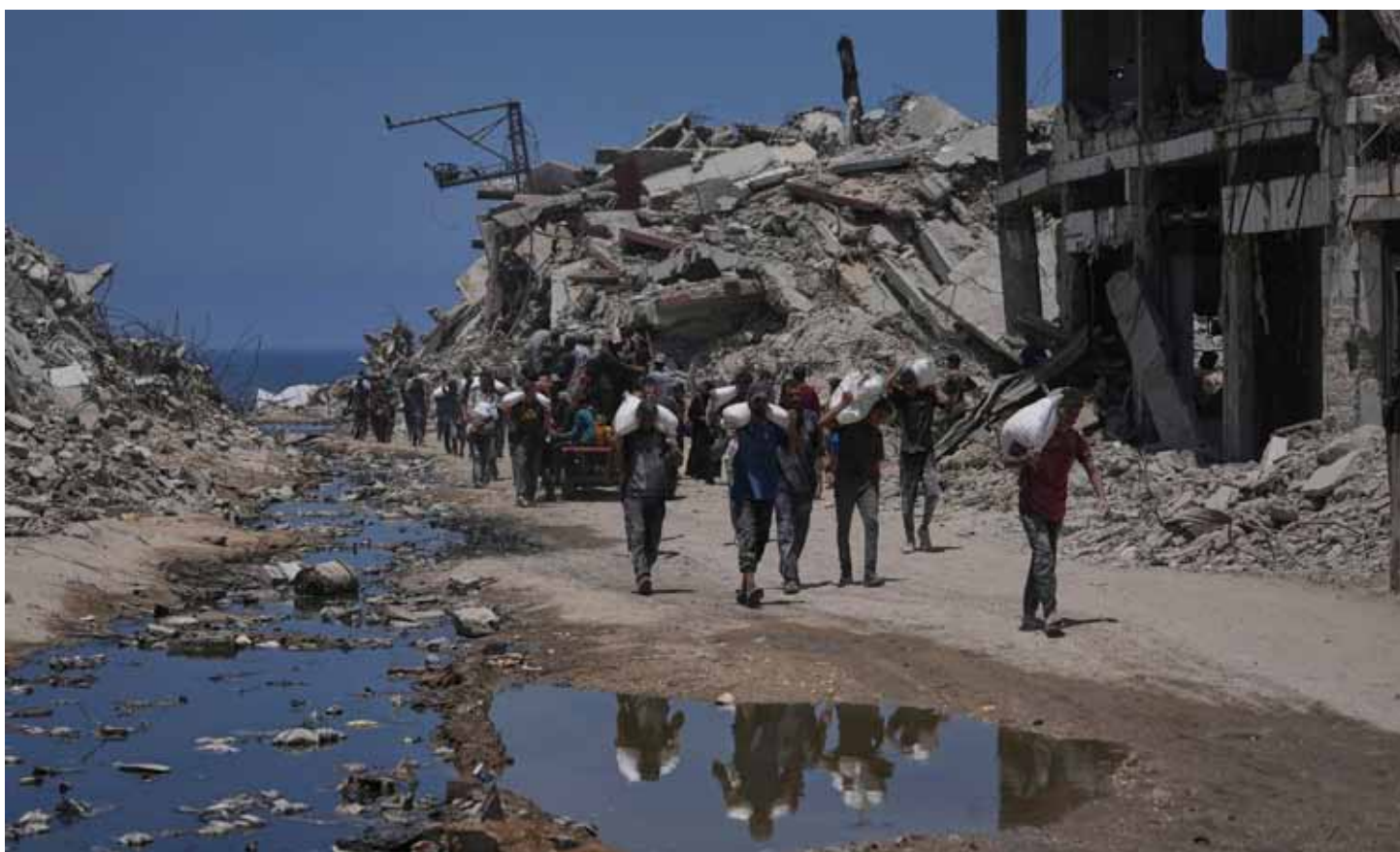
Las organizaciones benéficas advierten sobre los ataques israelíes en los puntos de entrega de ayuda.

mía, Luis Caputo. La medida sería la eliminación de los derechos de exportación para los novillos. No habría modificaciones para el caso de los granos, que es el reclamo más enfático de las entidades agropecuarias. Página 2