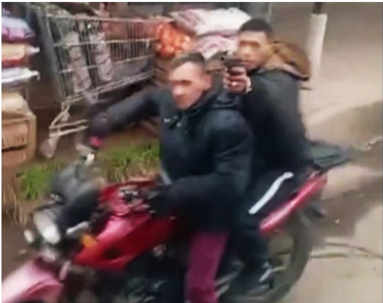
Tensión. El momento en el que los ladrones apuntaron a los pasajeros del micro quedó registrado en video. (X)

Además, se supo que el agresor había llegado en moto junto a un cómplice que actuaba como campana. (DIB)