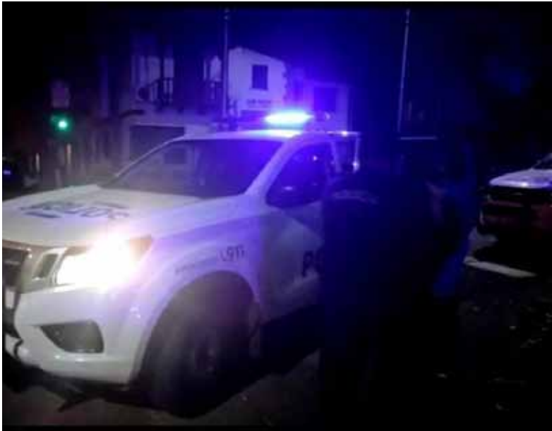
Reconstrucción. El hombre se encontraba en su casa con su pareja cuando salió a la vereda y fue atacado.

En esa línea, la investigadora ya ordenó medidas de prueba y busca determinar si el atacante y