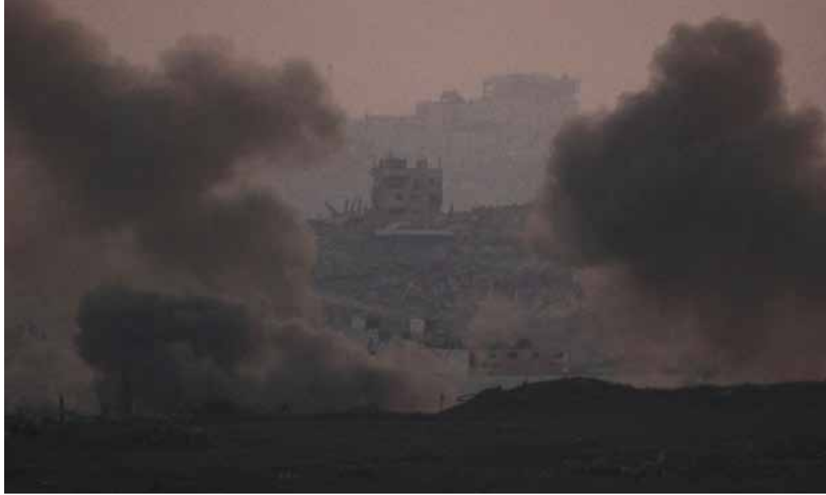
Más víctimas. Tras nuevos ataques en la Franja, otras 21 personas murieron.comunicar la decisión.

Hamás señaló que solo liberará a los 50 rehenes restantes, de los cuales se cree que alrededor de 20 están vivos, a cambio de un alto el fuego duradero y una retirada israelí, mientras que Israel ha prometido recuperar a todos