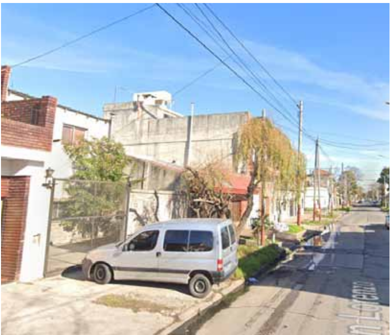
Crimen. Se produjo en una vivienda de la calle San Lorenzo al 1300, en Lanús Este.

La causa quedó caratulada como "homicidio agravado por el vínculo" y está en manos del fiscal Oscar Maidana, de la UFI 8 de Lanús. (DIB)