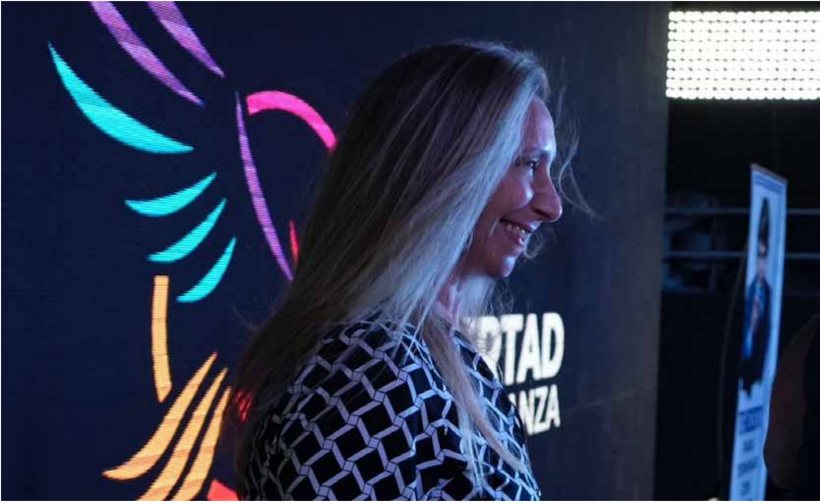
Advertencia. “Acá no se viene a especular. Se viene a defender con uñas y dientes las ideas del Presidente”, remarcó.

Milei recordó además el principio que el jefe de Estado marcó desde su primer día: “Tabula rasa, porque esta batalla no es para los tibios, pero tampoco es para unos pocos, y todo aquel que abrace con honestidad las ideas de la libertad, que esté dispuesto a dejarlo todo por el futuro de la Argentina, tiene un lugar en esta causa, siempre que entienda que acá no se viene a negociar convicciones, sino a dejar el alma por el proyecto de transformación que encarna Javier Milei”.